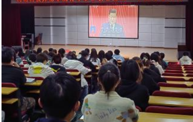
团员青年代表、学生会干部认真聆听报告

在集中收看党的二十大开幕会盛况后,学校还将第一时间认真组织师生开展学习研讨,不断掀起学习贯彻党的二十大精神的热潮。